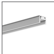
Profil REGULOR Ref: B468+43