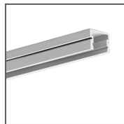
Profil PDS-4- PLUS Ref: C1263